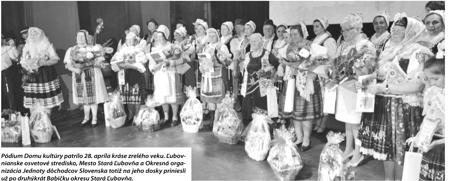
Pódium Domu kultúry patrilo 28. apríla kráse zrelého veku. Lubovnianske osvetové stredisko, Mesto Stará Ľubovňa a Okresná organizácia Jednoty dôchodcov Slovenska totiž na jeho dosky priniesli už po druhýkrát Babičku okresu Stará Ľubovňa.