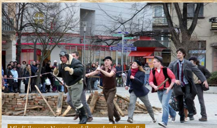
Mladí členovia Novozámockého rockového divadla v prvej scéne ako rozhnevaní občania

XXI. ročník | číslo 11 | 25. marca 2011 | Nepredajné