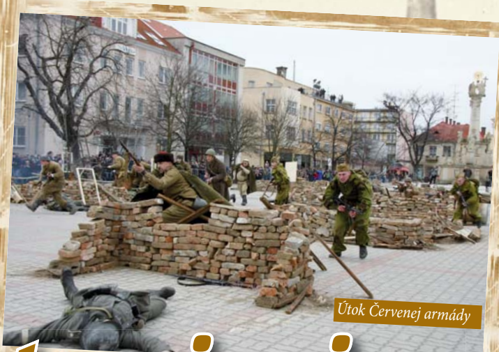
Útok Červenej armády