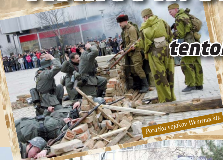
Porážka vojakov Wehrmachtu

zažili Novozámčania tentokrát na Hlavnom námestí