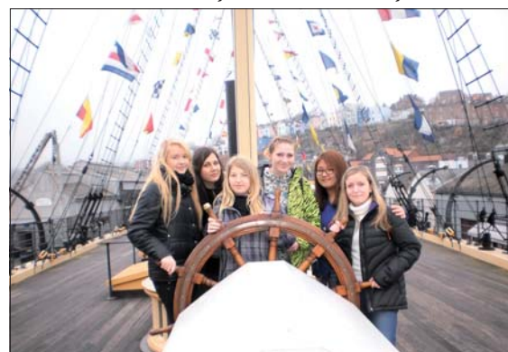
...ale aj spoznávali krajinu.