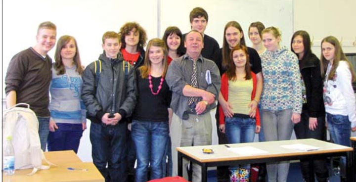
Študenti sa počas jarných prázdnin v Anglicku nielen vzdelávali...